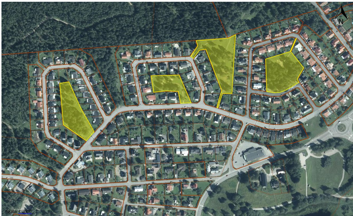
Illustration av bostadsområde från 1960-talet i Sidsjön som visar på hur bebyggelsen är placerad runt allmänningar.