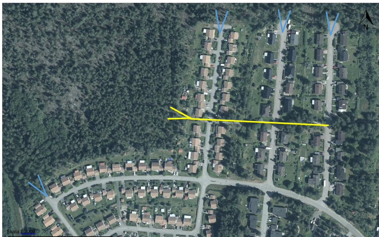
Illustration av bostadsområde i Övre Bredsand som visar kopplingar och stråk som leder ut mot skogspartier.

Eftersom denna företeelse är väldigt vanligt förekommenade, har vi valt att inte specifikt markera dem på kartan, utan visar istället ett exempel nedan: